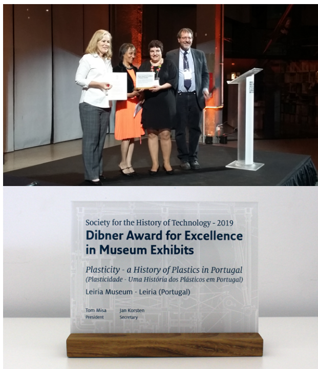
Receção do Dibner Award, Milão, outubro 2019.